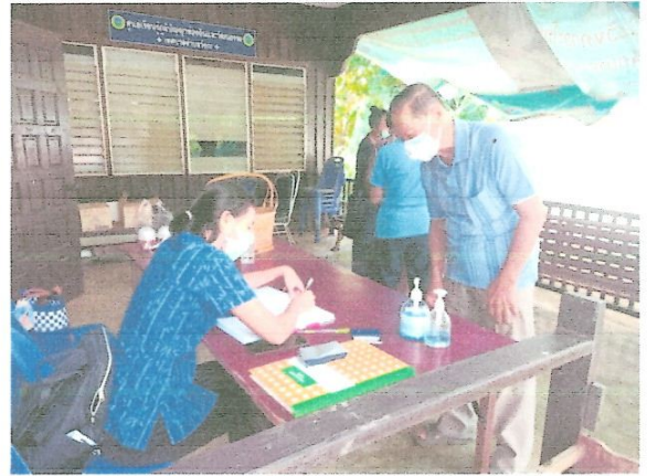
ลงทะเบียน