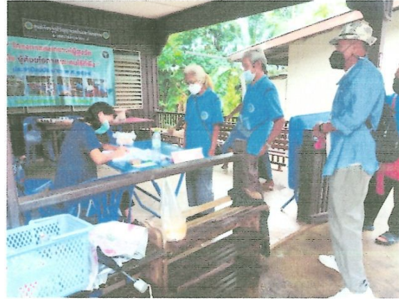
ลงทะเบียน