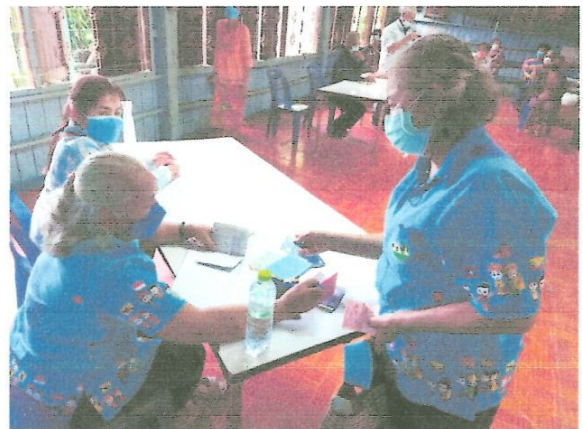
สมาชิกชมรมผู้สูงอายุฝากเงินออมทรัพย์ เงินฌาปนกิจ และกองทุนสวัสดิการ