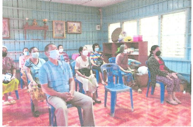
ออกกำลังกายด้วยวิธีกำหนดลมหายใจ